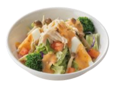
蒸し鶏とキノコのサラダS (1人前) 409円 (税込450円)

＼いつものメニューにプラスワン・アレもコレも食べたい！／ お好みの商品を組み合わせせて、オリジナルメニューを楽しめます！