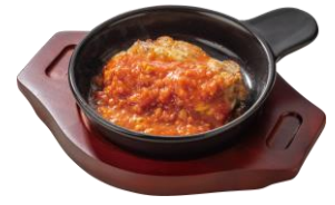
若鶏のグリルガーリックソース(1枚) 409円 (税込450円)