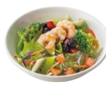
海老とフルーツのサラダS (1人前) 409円 (税込450円)