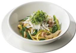
しらすと九条ネギの 出汁醤油バター(ハーフ) 409円 (税込450円)