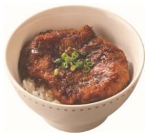
ミナレカツ丼 409円 (税込450円)