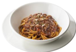
濃厚ミートソース (ハーフ) 409円 (税込450円)