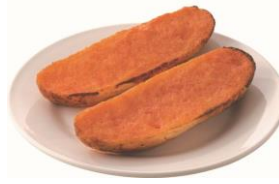
焼きたて明太トースト(2個) 318円 (税込350円)