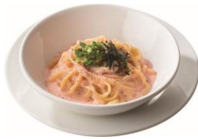
明太クリーム (ハーフ) 409円 (税込450円)