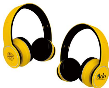
5ポイントコース Ado コラボヘッドフォン(3,000名様)

5ポイントコース :Ado コラボヘッドフォン(3,000名様) 10ポイントコース:オーブントースター&Ado プレートセット(100名様)