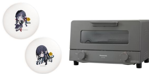
10ポイントコース オーブントースター&Ado プレートセット(100名様)