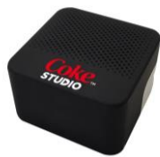
手のリスピーカー（火曜日）