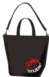
トート型保冷バッグ（土曜日）