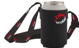
コーク缶専用クージー