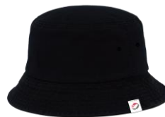
オリジナルハット（日曜日）