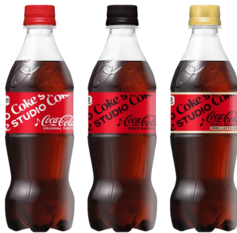
「コカ・コーラ」「コカ・コーラ ゼロ」「コカ・コーラ ゼロカフェイン」