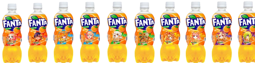
「ファンタ オレンジ」500ml PET