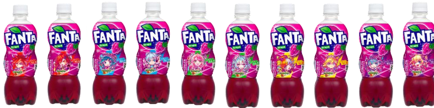
「ファンタ グレープ」500ml PET

「ファンタ」×「モンスト」デザインの限定コラボボトルは、ゲーム内で人気の 21 体のキャラクターデザインを各フレーバーで展開します。「ファンタ」らしいグレープ・オレンジカラーに染まったキャラクターデザインは、今回のコラボボトル限定で楽しめます。