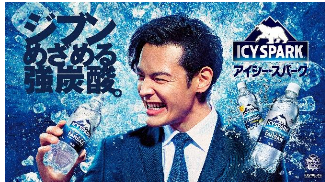
「アイシー・スパーク レモン from カナダドライ」 490ml

今回のリニューアルでは、「ジブンめざめる強炭酸」の製品コンセプトをより強く表現するためにパッケージを刷新しています。リニューアルにあわせて、幅広い世代に人気があり、刺激と熱量をもった作品を提供している『シン・ジャパン・ヒーローズ・ユニバース』(以後、「S.J.H.U.」)とコラボしたデザインを採用。コラボボトルは、『シン・ゴジラ』『シン・エヴァンゲリオン劇場版』『シン・ウルトラマン』『シン・仮面ライダー』各キャラクター3種類ずつと、『S.J.H.U.』集合パッケージ1種類の全13種類が登場します。