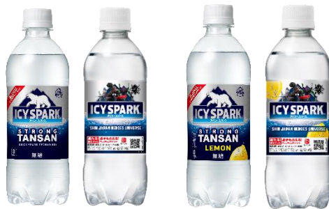
「アイシー・スパーク from カナダドライ」 500ml

コカ・コーラシステムは、日本コカ・コーラ史上最強の強炭酸水※1「アイシー・スパーク from カナダドライ」(以後、「アイシー・スパーク」)と、「アイシー・スパーク レモン from カナダドライ」(以後、「アイシー・スパーク レモン」)の2製品のパッケージデザインをリニューアルし、2月27日(月)より全国で発売します。