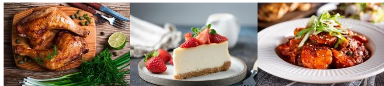
あなたのためのごちそう定期便 ※画像はイメージです