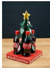
パーティーツリー