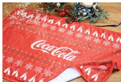
ホリデーブランケット