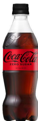
「コカ・コーラ ゼロ」 「コカ・コーラ ゼロカフェイン」 500mlPET