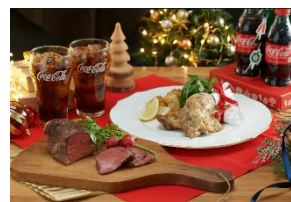
パーティーミールキット