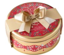
クリスマススイーツ