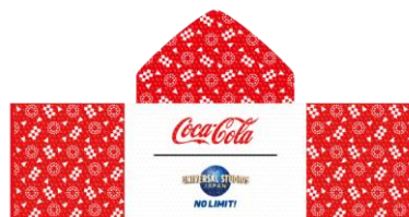
オリジナル フード付きクールタオル