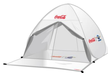
オリジナル ワイドワンタッチテント