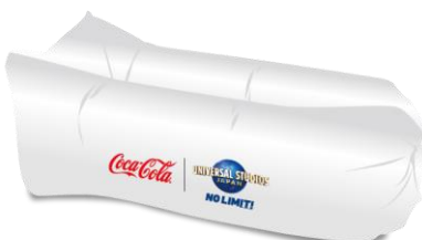
オリジナル エアソファー