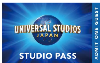
ユニバーサル・スタジオ・ジャパン ペアチケット