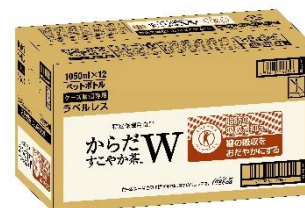
<1050ml PET / 製品カートン>

※1 2 つの保健の用途(脂肪の吸収を抑える、糖の吸収をおだやかにする)をもつ清涼飲料水の特定保健用食品として、日本で初めて許可・販売