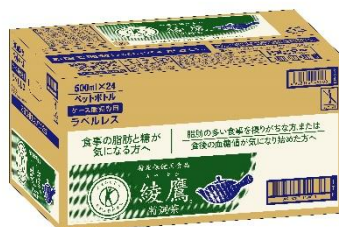
<500ml PET / 製品カートン>

※2 販売中の緑茶(清涼飲料水)の特定保健用食品として唯一、『脂肪の吸収を抑える』、『糖の吸収をおだやかにする』という 2 つの働きをもつ製品(2021 年 11 月 18 日時点)