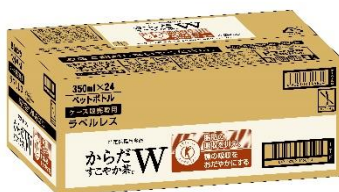
<350ml PET / 製品カートン>