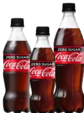
コカ・コーラ ゼロ（500ml、350ml、700ml）

パッケージ/メーカー希望小売価格（消費税別）： 350ml PET/120 円、500ml PET/147 円、700ml PET/195 円