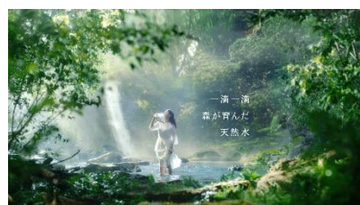
【土屋さん】 一滴一滴 森が育んだ 天然水