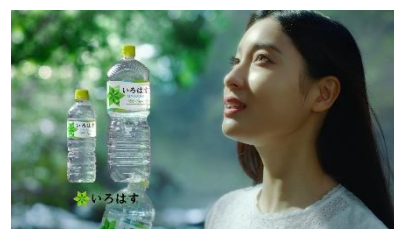
【土屋さん】 「いろはす」