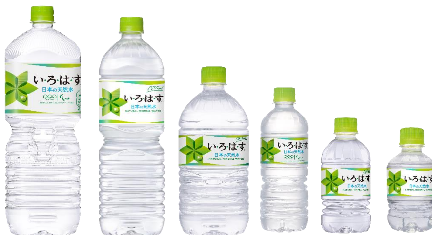
「い・ろ・は・す 天然水」

左から 2L PET、1555ml PET、1020ml PET、555ml PET、340ml PET、285mlPET