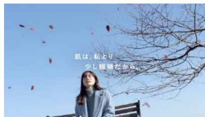
肌は、私より 少し繊細だから。