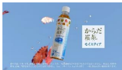
からだ巡茶 モイスティア