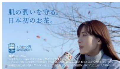
肌の潤いを守る。 日本初のお茶。