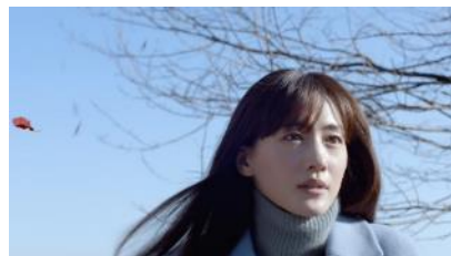
たいてい肌が 教えてくれる。