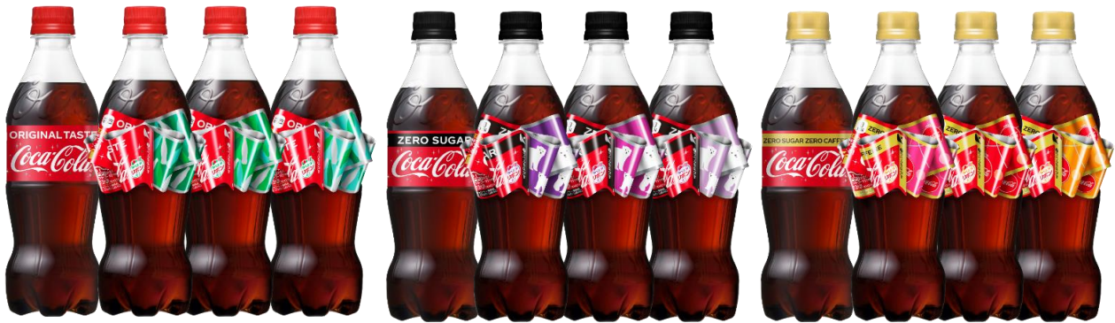
コカ・コーラ オリジナル