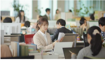
1.あれこれ仕事もりだくさん