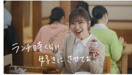
8.ランチ時くらい好きにさせてよ!