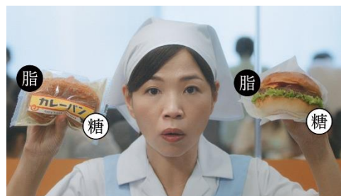
5.これにもこれにも