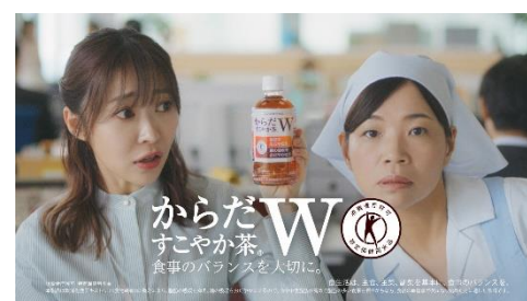
8.からだすこやか茶 W～♪