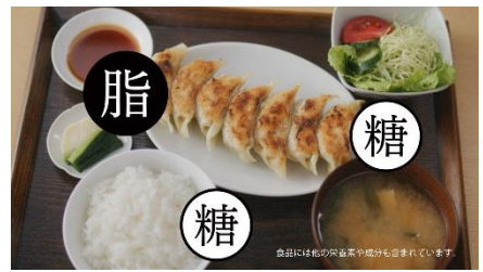
5.脂肪を糖で包んだランチセット