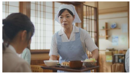
4.はい、本日のおすすめ