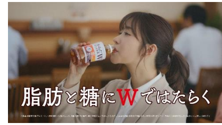
11.脂肪と糖にWではたらく