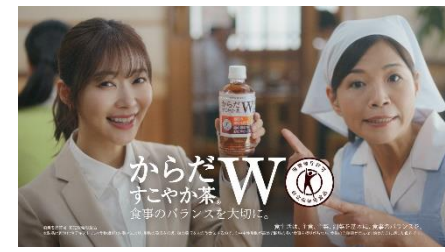
12.からだすこやか茶 W〜♪