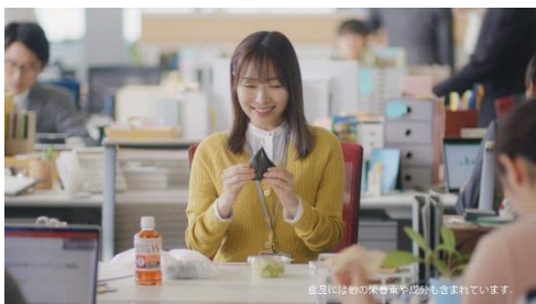
1.サクッとランチにも脂肪と糖が