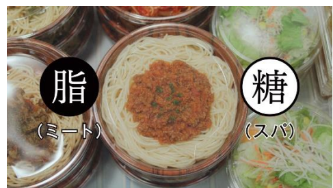
4.ミートにもスパにも