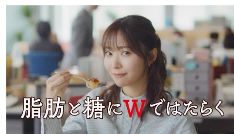
7.脂肪と糖に W ではたらく