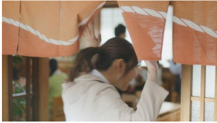
2.やっと自由なランチ時