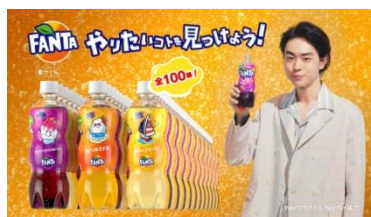
菅田さん: 今年の夏はオイシすぎる！ 「ファンタ」！