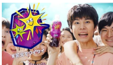
男子: 花火やりたい！