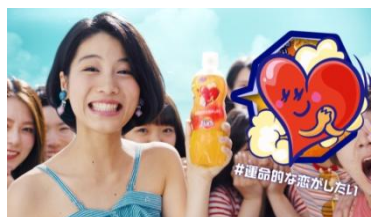
女子: 恋したい！菅田部長は！？