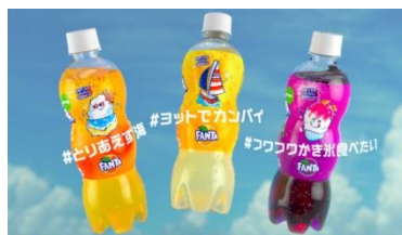
菅田さん: 海行って！ ヨットで！ かき氷！