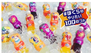
菅田さん: 夏の「ファンタ」は 「ほくらのやりたい 100 のコト！ ボトル」！