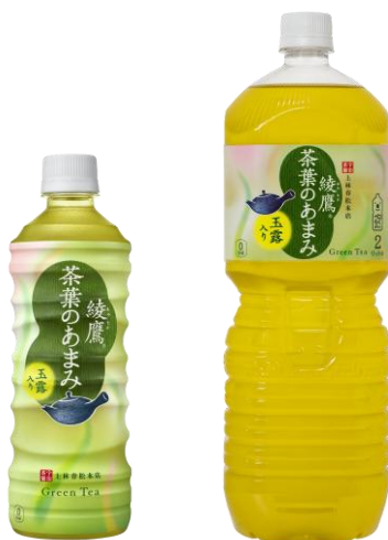
「綾鷹 茶葉のあまみ」525ml PET／2L PET

コカ・コーラシステムは、急須でいれたような緑茶の味わいを目指す緑茶ブランド「綾鷹」より、茶葉本来のもつ“あまみ”を引き出した新製品「綾鷹 茶葉のあまみ」を、2018年2月26日(月)より全国で発売します。