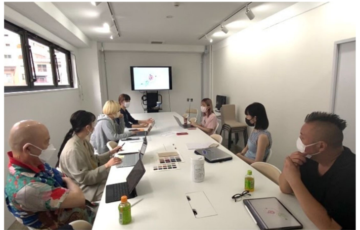
↑デザインミーティングの様子

昨今、自身でブランドを立ち上げ、ECサイトで販売するのは容易くなっています。その一方で、デザイナーは購入してくれたお客さんのためにブランドを長く続けることや、常にブランド価値を上げ続けるのは、とても難しいのが現状です。また、洋服づくりには素材の決定からデザインの決定・製造工場への依頼・ブランディング・在庫管理・販売など様々には、実績や経験が必要とされています。