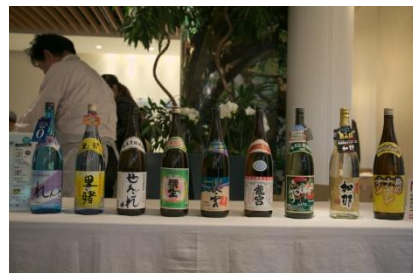
奄美名産の黒糖焼酎