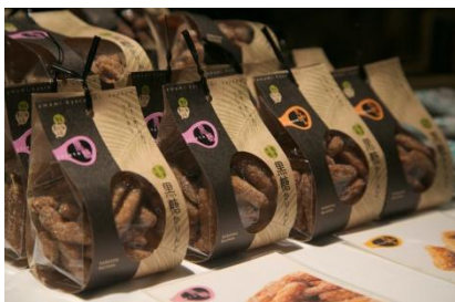
奄美大島の黒糖を用いたかりんとう