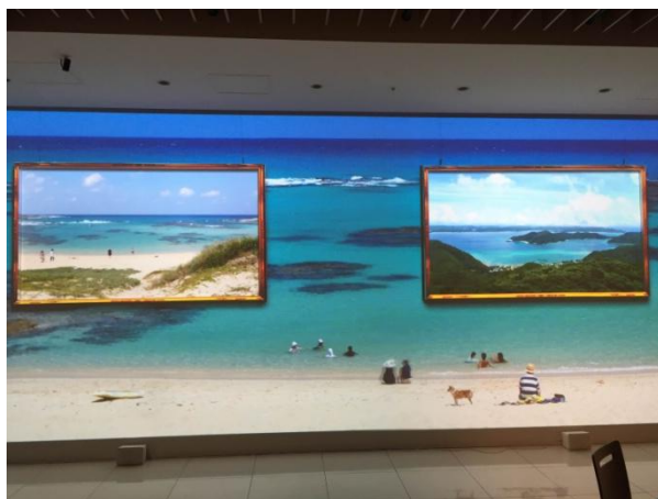
奄美大島プロジェクトマッピング 奄美の海