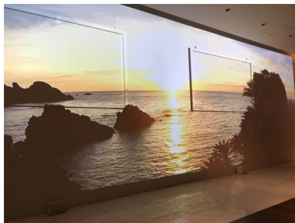
奄美大島プロジェクトマッピング タ焼け

六本木ヒルズカフェの1つの壁面をまるごと利用し、奄美大島の実写映像を投影する約10分間のプロジェクトマッピングを実施しました。奄美の美しい情景と共に奄美大島で録音した自然の音源を流すことで、実際に奄美大島にいるかのような幻想的な空間を演出します。本プロジェクトマッピングは、3月8日と3月9日の2日間にわたり公開を予定しています。