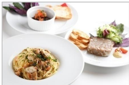
ヒルズカフェコラボスペシャルメニュー

3月8日16:00～21:00、9日10:00～17:00はイベント会場を「あまみつけ。カフェ」として一般公開します。奄美大島の物産品である肉みそ、トビンニャ、黒糖を使用した奄美大島オリジナルメニューをヒルズカフェとコラボし、販売致しました。また、「あまみつけ。カフェ」においては奄美大島で作られている黒糖焼酎が約10種類用意され、飲み比べを楽しむ事が出来ます。また、奄美大島を代表する織物である本場奄美大島紬によって作られたグッズなどが用意されました。