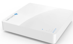
Linksys 5G Modem