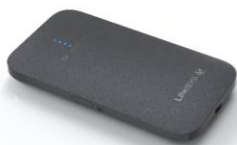
Linksys 5G Mobile

・ミリ波 5G ネットワークと 10Gbps 有線接続による超高速インターネット接続