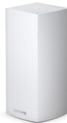
Velop WiFi 6 system (AX4200)