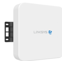
Linksys 5G Outdoor Router