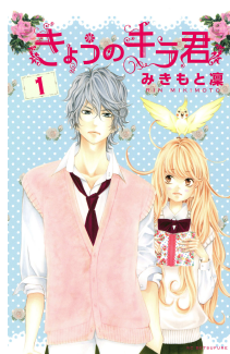
『きょうのキラ君』 みきもと 凜