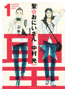
『聖☆おにいさん』 中村 光