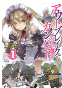
『アウトブレイク カンパニー』 榊 一郎