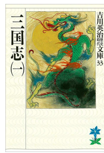
『三国志 全一冊合本版』 吉川 英治