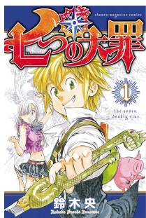
『七つの大罪』 鈴木 央