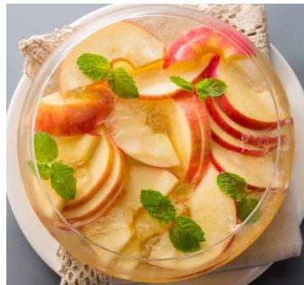
＜りんごの芯を引き抜くと…＞