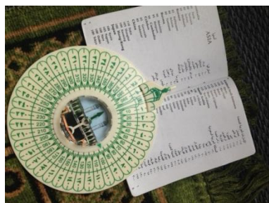
メッカの方角を知るためのコンパス

～ムスリムは一日に5回、メッカの方角に向かって祈りを捧げることが習慣となっています～