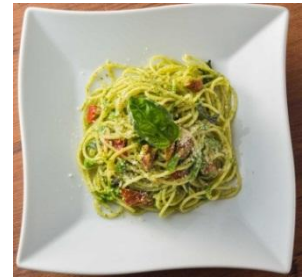
【ジェノベーゼ】 780円（税抜）