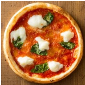
【マルゲリータ】 590円（税抜）