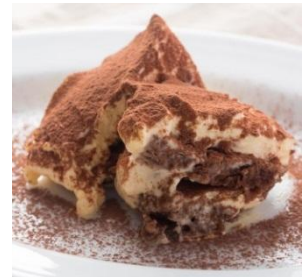
【自家製ティラミス】 330円（税抜）