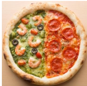
【海者のジェノベーゼ&イタリアンサラミ】 890円（税抜）