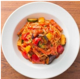
【ベーコンと彩り野菜のトマトソース】 680円（税抜）