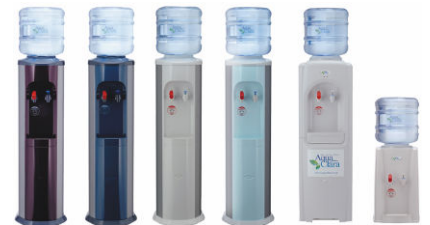
アクアクララのウォーターサーバー

オフィスや家庭向け専用ウォーターサーバーの業界最大手として同業界では唯一の全国展開ブランドとなっている。