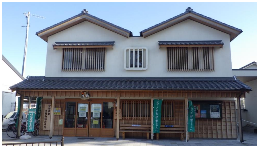
伊勢市情報発信センター 伊勢広報事務所（JR伊勢市駅手荷物預かり所2階）

伊勢市は、2016年5月26日～27日に開催される伊勢志摩サミットに向けた伊勢市での国内外メディア対応拠点として、「伊勢市情報発信センター」を2016年2月1日（月）に開設いたしました。