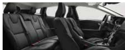
インテリアカラー:チャコール/チャコール、ヘッドライニングカラー:ブロンド、シートカラー:チャコール(P000)