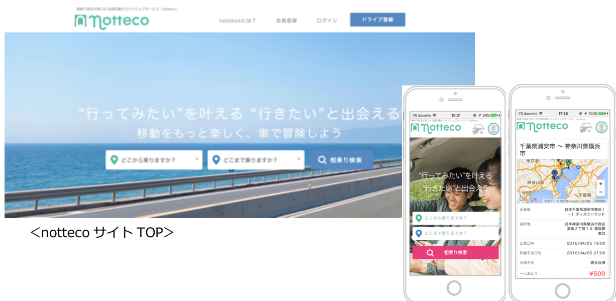
<notteco サイト TOP>

これにより、今後本格的にサービスを提供するにあたり利用者に安心してサービスを利用いただくことができるようになりました。notteco としては、さらに今後、生活交通が課題となっている交通過疎地における新たな交通手段としての展開も進めていく予定です。