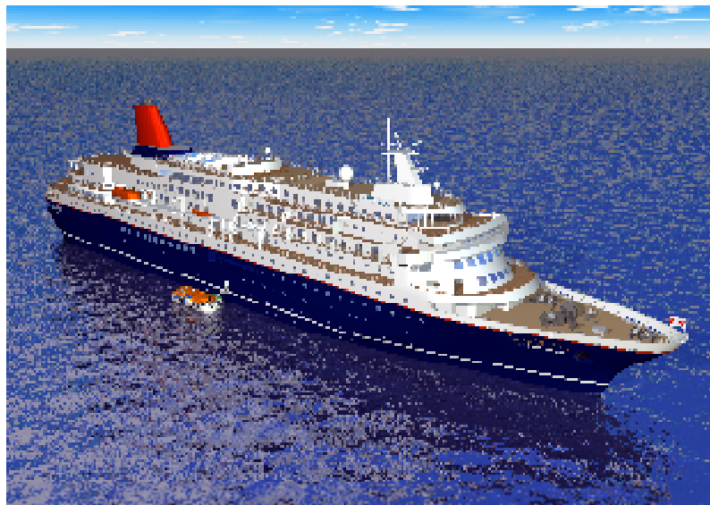
「New につぼん丸」完成イメージ図

※2月中旬の検査後に確定しますが、現につぼん丸の総トン数 21,903 トンよりも大きくなる予定です。