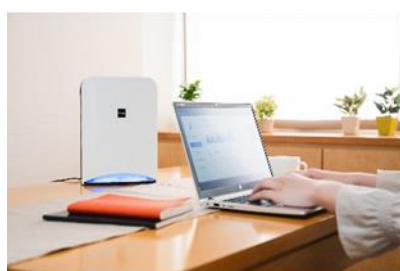
エアロピュア シリーズ S

日機装は、様々なウイルスや細菌が存在する環境下で活動される皆様のために、これからも空間除菌の技術で貢献できる製品をお届けします。