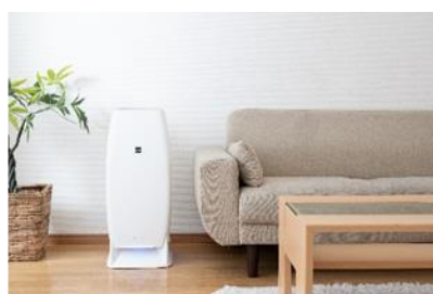
エアロピュア シリーズ M