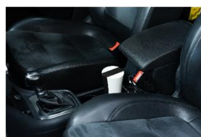
エアロピュア シリーズ P

製品 HP : https://healthcare.nikkiso.co.jp/