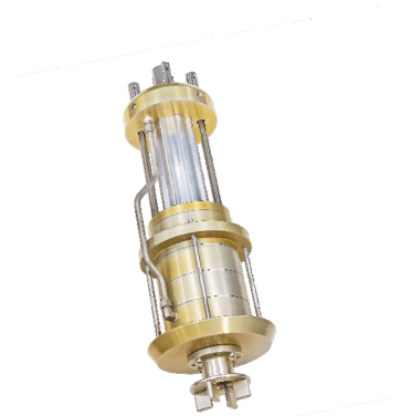
Submerged Motor Pump 「TC-34.2」