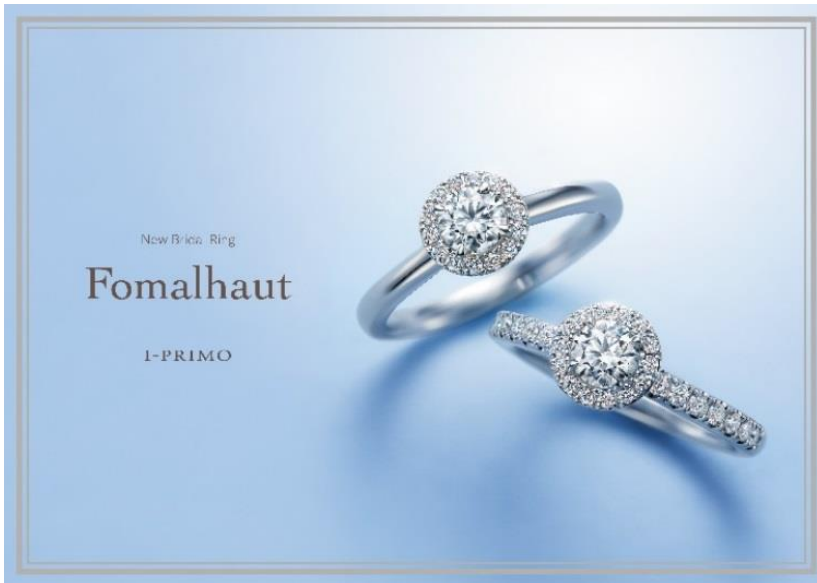
フォーマルハウト(左) 素材:プラチナ950 カラット:0.2ct~ 価格:268,000円~ フォーマルハウト Ete(右) 素材:プラチナ950 カラット:0.2ct~ 価格:360,000円~

ブライダルジュエリーの企画・販売を行うプリモ・ジャパン株式会社(本社:東京都中央区、代表取締役社長:澤野直樹)が運営するブライダルジュエリー専門店「アイプリモ」は、ジューンブライドのシーズンに合わせて新作婚約指輪「Fomalhaut(フォーマルハウト)」を2016年6月11日(土)に全国の店舗で発売いたします。