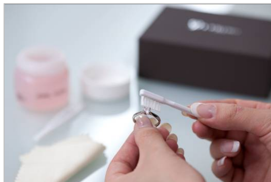
充実のアフターケアで大切な指輪を末永く身に着けられます