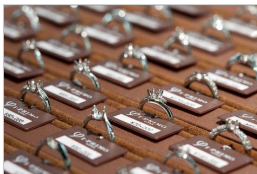
多彩なデザインバリエーションよりチョイス