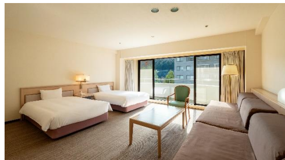
デラックス洋室（北館）17,000 円～