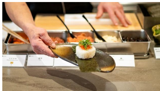
(御殿場産コシヒカリのおにぎり)