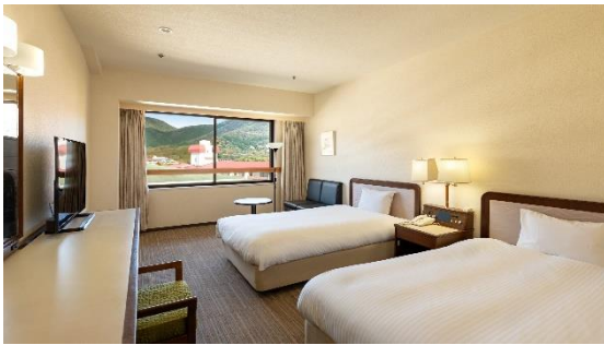
スタンダードツイン（南館）14,000 円～