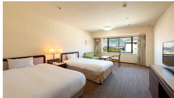
スタンダード洋室（南館）15,000 円～