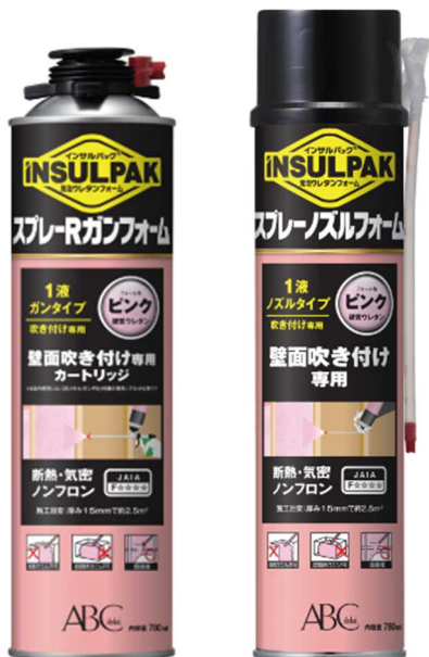
スプレーR ガンフォーム スプレーノズルフォーム