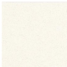
リコリアイボリー (RCI)