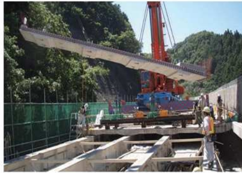
プレストレストコンクリート床版