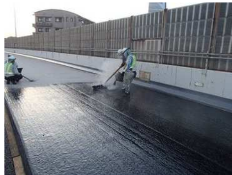
高性能床版防水工

これらのリニューアル工事の他、傷んだ舗装路面の修復、老朽化した道路付属物の取り替え、道路維持作業、道路構造物や設備の点検・補修などもあわせて実施いたします。