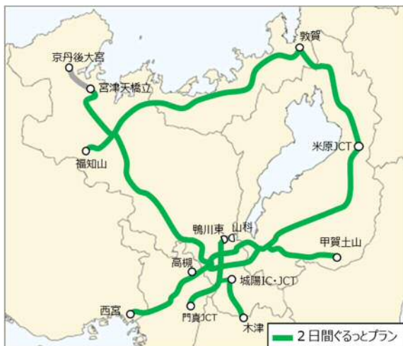
2 日間ぐるっとプラン