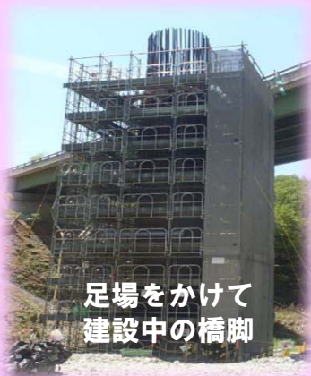
足場をかけて 建設中の橋脚

現場は工事最盛期であり、開通後には見ることができない迫力のある高速道路の現場をぜひご覧ください!