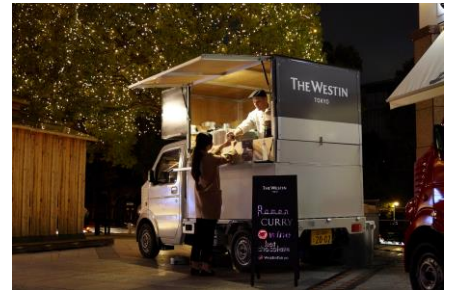
＜過去開催時の様子＞