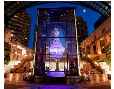
「バカラシャンデリア」光の演出 過去開催時の様子