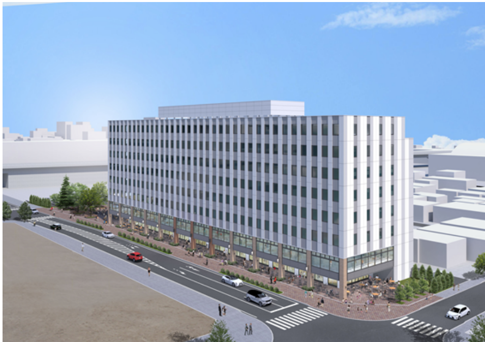
サッポロ不動産開発株式会社 N4E4 ビル（仮称）外観イメージ

本事業は、当社が札幌で手掛ける再開発事業としては、2017年のTDYショールーム（札幌市中央区北3条東4丁目／旧サッポロファクトリー第3駐車場区画）以来となります。札幌市の「都心における開発誘導方針」に基づき、北海道新幹線の札幌延伸等による周辺環境の変化を捉え、新たな働き方に対応するオフィスを中心とした8階建ての複合型商業・オフィスビルとして2024年8月のグランドオープンを予定しています。