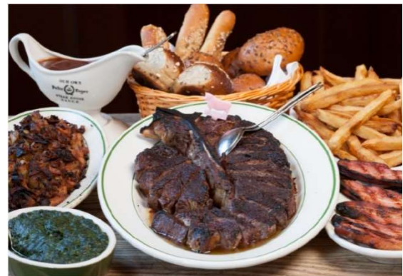
「Peter Luger Steak House Tokyo」メニューイメージ