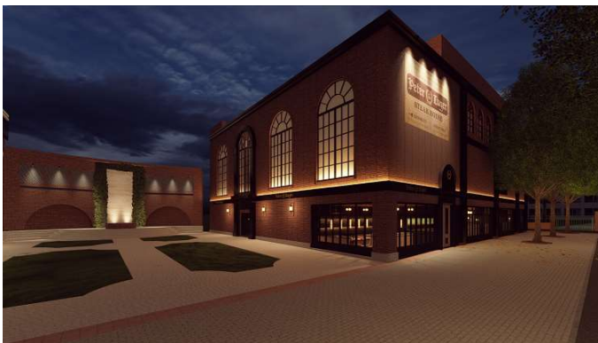
「Peter Luger Steak House Tokyo」店舗外観イメージ