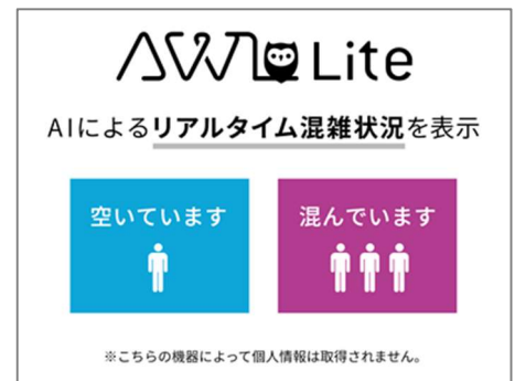
「AWL Lite」混雑状況表示イメージ

本実証実験では、AWL株式会社のAIカメラソリューション「AWL Lite」をサッポロファクトリーに導入します。施設内飲食店入口にAI搭載カメラ「AWL Lite」10インチタブレットを設置。店舗の混雑状況を取得し、サッポロファクトリー内の通路に設置したデジタルサイネージ上に表示します。また、デジタルサイネージに設置したAI搭載カメラ「AWL Lite」STB型端末を用いてデジタルサイネージの視聴者分析を行い、視聴者に対して最適な店舗提供メニューを表示し、飲食店舗への自発的な回遊行動の効果測定を行います。これにより視聴者は、自身に適した施設内の情報を、リアルタイムの混雑状況とともに把握することが可能になります。