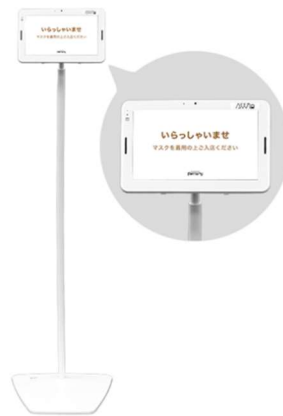
「AWL Lite」10インチタブレット店舗設置イメージ