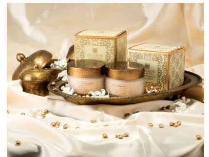
ブライトニング フェイシャル スクラブ 2種