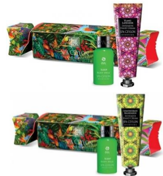
フェスティブ クラッカー 2種

また、アーユルヴェーダ処方に基づいた自然由来の成分を配合し、肌をなめらかに整えながら、花々の香りが心も満たす「ブライトニング フェイシャル スクラブ 2種」が4月3日（水）に新発売となります。