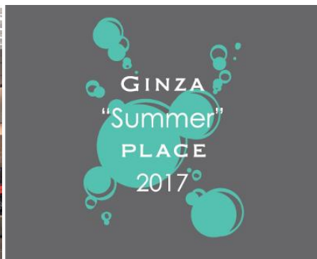
「GINZA “summer” PLACE 2017」 メインビジュアル