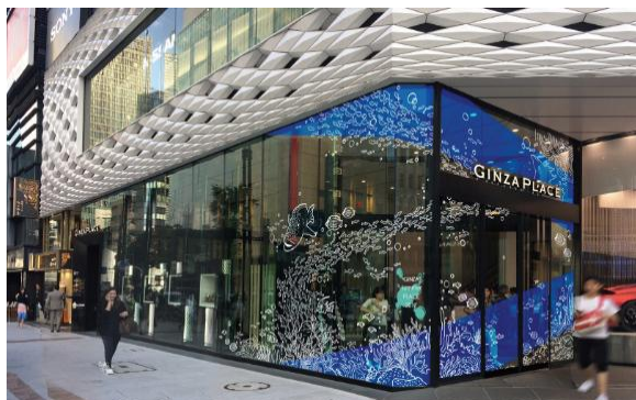
「GINZA PLACE」エントランス掲出イメージ

GINZA PLACEは、世界有数の商業エリア・銀座の中心に位置し、「発信と交流の拠点」をコンセプトに、訪れる人に様々な体験と多彩な交流を生み出しながら継続的な情報発信を行ってまいります。