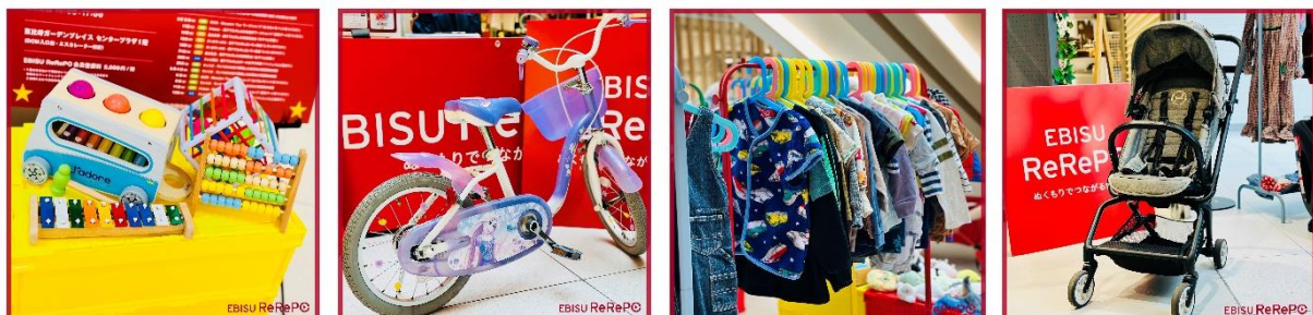
サービスイメージ

今回の実証実験を通じて、「『ひと』や『まち』への貢献のために行動する方々」との繋がりを深め、よりエコでスマートで心地よいコミュニティを形成しながら、サービスの更なる改善点を抽出し、今後の事業展開を目指します。