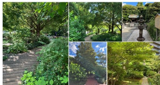
認定されたサッポロ広場の様子

1994年の恵比寿ガーデンプレイス開業当時からあるサッポロ広場は、都会の真ん中に居ながらも自然が感じられ、「集う、憩う、つながる」を実現するような、地域にとって開かれた場所を目指し、2017年にリニューアルされました。今回の審査では、サッポロ広場が近隣の緑地と一体となり、緩衝機能や連続性・連結性を高める機能が期待されることから、本認定に至りました。