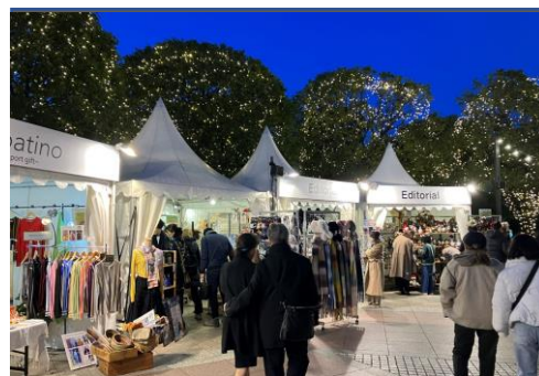
<過去開催時の様子（時計広場）>