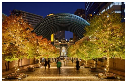
<過去開催時の様子>