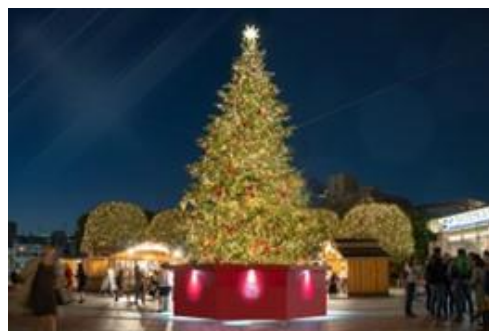
<過去開催時の様子>