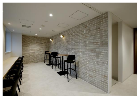
3階リフレッシュコーナー