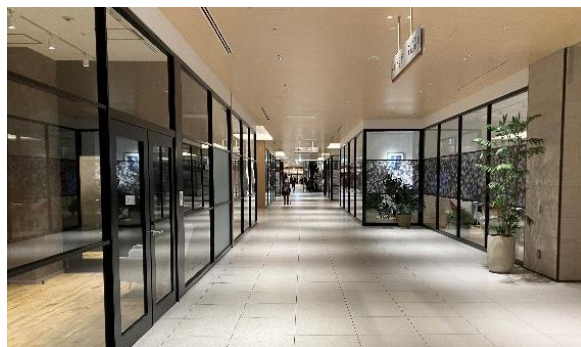
恵比寿ガーデンプレイス センタープラザ（外観・B1 オフィス）