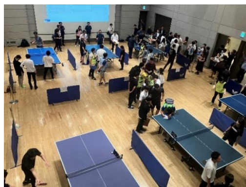
プログラムの一例（恵比寿文化祭2023、恵比寿ガーデンプレイス ワーカー限定卓球大会）