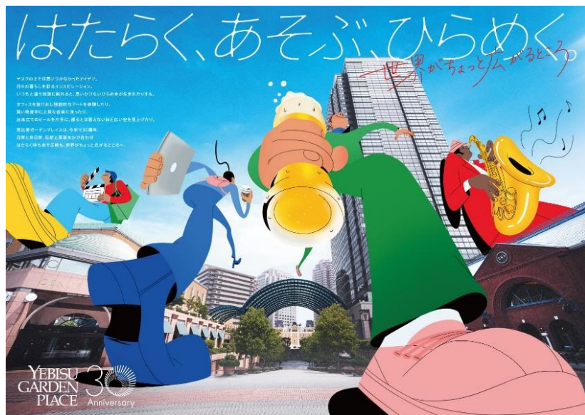
新コンセプトキービジュアル