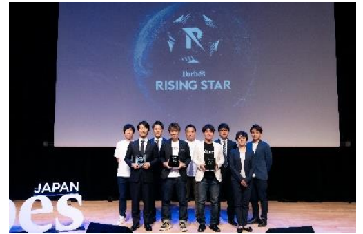
<RISING STAR AWARD 2023 の模様>

創業3年以内の優れたスタートアップ企業を表彰する Forbes JAPAN 主催の RISING STAR AWARD のスポンサーとなり、新しく世の中に羽ばたく成長企業を支援します。2024年4月25日(木)に恵比寿ガーデンプレイスを会場に、ピッチコンテストや有名起業家のトークセッションなどを実施予定です。また、ピッチコンテストでは、特別賞として、恵比寿ガーデンプレイス「はたらく、あそぶ、ひらめく。」賞(仮)を創設。恵比寿ガーデンプレイスのブランドコンセプトである「はたらく、あそぶ、ひらめく。」を体現し、新しい価値を創出するスタートアップ企業を表彰します。