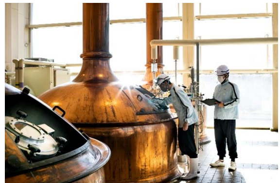
<ビール醸造イメージ>