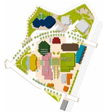
恵比寿ガーデンプレイス MAP