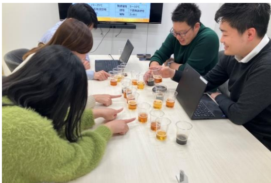
<ワークショップイメージ>