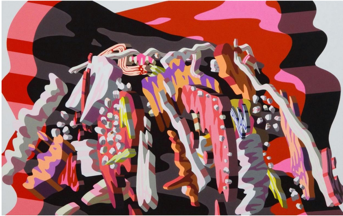
1月10日(月)～1月27日(木)開催、山口聡一「The Paint of Mount Fuji」：EUKARYOTE(東京)より

1月5日から開催されるサテライト展は、日本各地の会場がそれぞれ企画、キュレーションした展覧会やアートイベントを開催します。展覧会やイベントの出展作品とその詳細は、 富士山展公式サイト と、 startbahn でも閲覧・購入が可能です。展示作品は、ブロックチェーン証明書による来歴を残すことが可能です。また展示作品のうち、the gallery @ engawa KYOTOでの一部作品はサービスを横断し、 B-OWND と連携しています。